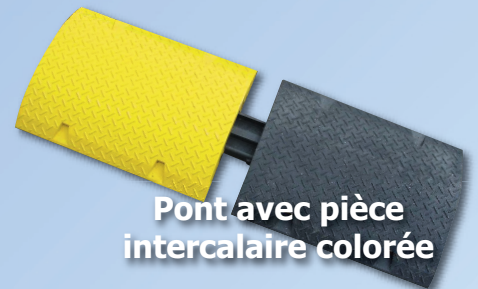
Pont avec pièce intercalaire colorée