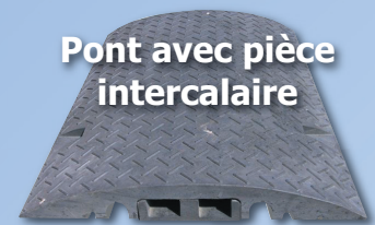
Pont avec pièce intercalaire