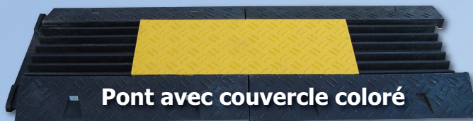
Pont avec couvercle coloré