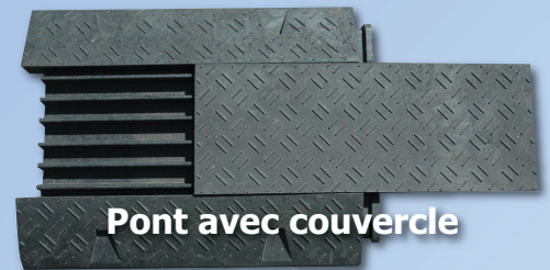
Pont avec couvercle