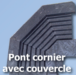
Pont cornier avec couvercle