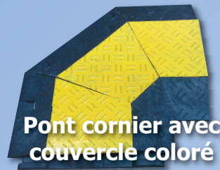
Pont cornier avec couvercle coloré