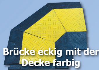
Brücke eckig mit der Decke farbig