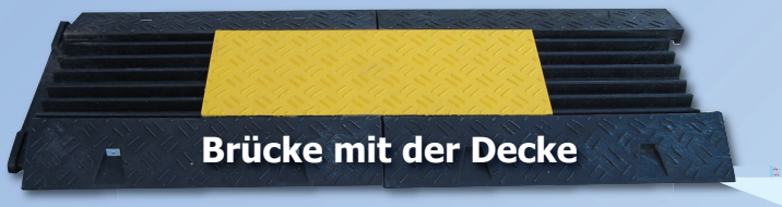
Brücke mit der Decke