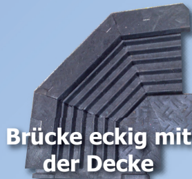
Brücke eckig mit der Decke