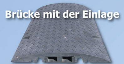
Brücke mit der Einlage