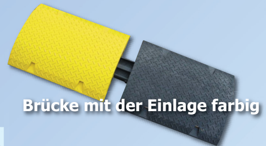
Brücke mit der Einlage farbig