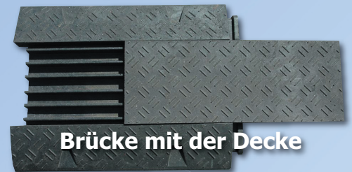
Brücke mit der Decke